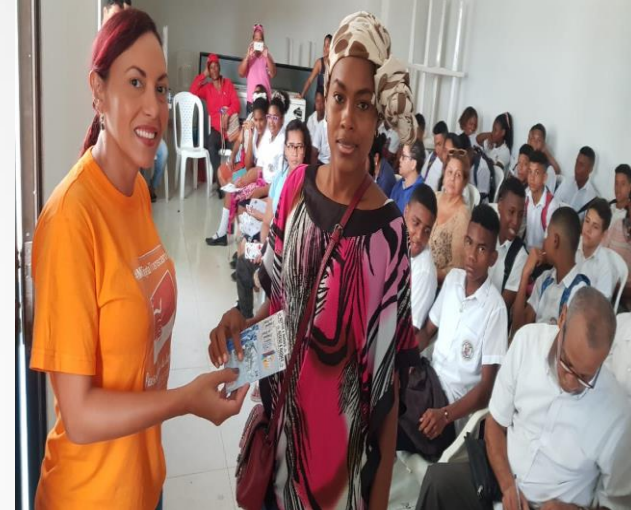
Entrega de tarjetas del SITM y boletas de entrada al SAIL CARTAGENA