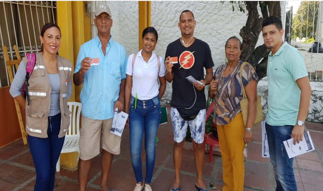
Entrega de Tarjetas cortesía del SITM